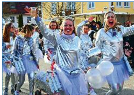
»Uschis on Tour« – Beste Freundinnen völlig losgelöst