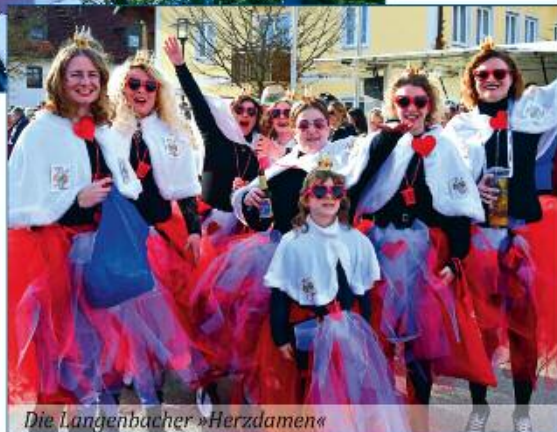
Die Langenbacher »Herzdamen«