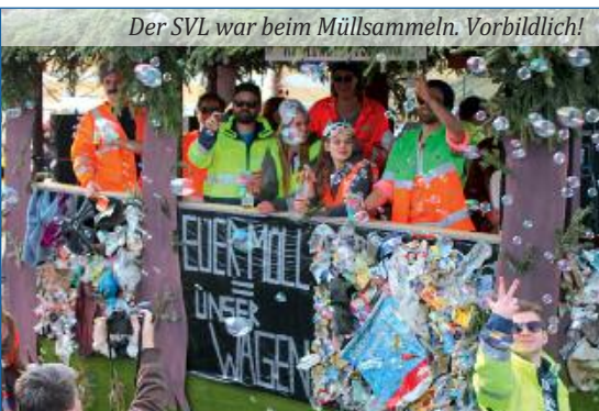
Der SVL war beim Müllsammeln. Vorbildlich!