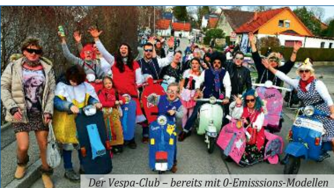
Der Vespa-Club – bereits mit 0-Emissions-Modellen