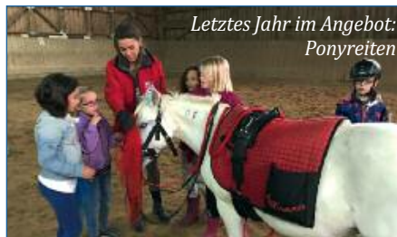
Letztes Jahr im Angebot: Ponyreiten