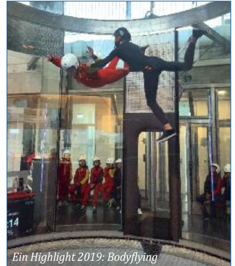
Ein Highlight 2019: Bodyflying