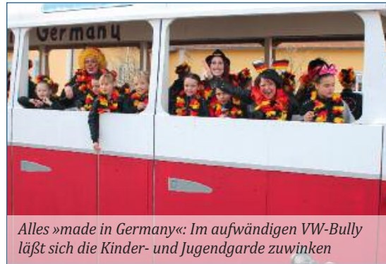
Alles »made in Germany«: Im aufwändigen VW-Bully läßt sich die Kinder- und Jugendgarde zuwinken