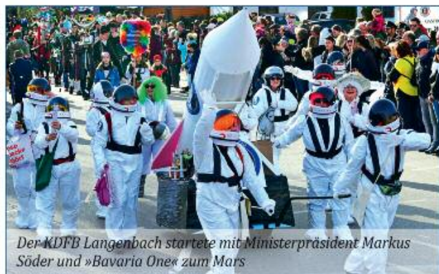
Der KDFB Langenbach startete mit Ministerpräsident Markus Söder und »Bavaria One« zum Mars