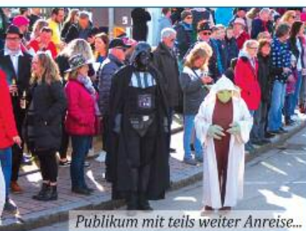
Publikum mit teils weiter Anreise...