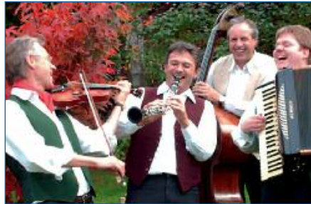
Die Musiker von »Boaritango« – ein Garant für beste Unterhaltung – geben sich beim diesjährigen Langenbacher Bürgerfest die Ehre.

Challenge« statt, bei der wir auf zahlreiche Wettkämpfer und Zuschauer hoffen. Es soll ein Mannschaftswettbewerb werden und alle Vereine und Gruppierungen, Familien und Freundeskreise sind aufgerufen, Teams zu stellen. Attraktive Gewinne warten auf die Teilnehmer. Genauere Angaben zu den Modalitäten der Anmel-