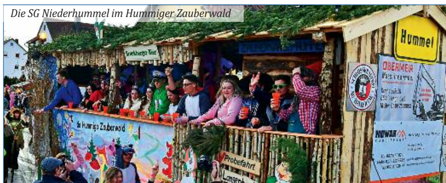
Die SG Niederhummel im Hummiger Zauberwald