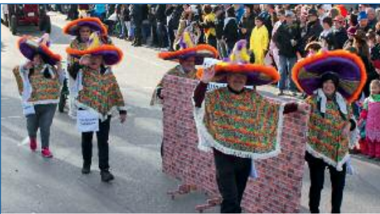
Die Langenbacher Wanderfreunde kraxeln über die mexikanische Mauer