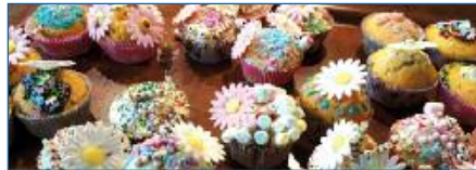
Muffins backen im Ferienprogramm 2019

Engagiere dich für Kinder zwischen 6 und 16 Jahren im Rahmen des Ferienprogrammes bei der Planung der vielfältigen Veranstaltungen, Betreuung bei Ausflü-