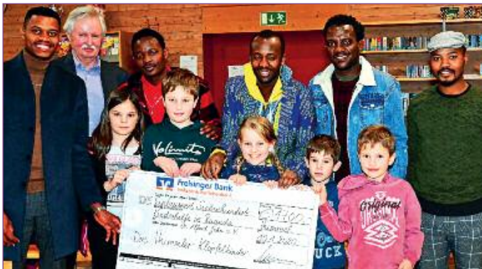
Die Klöpfelkinder aus Hummel konnten 1.700 Euro übergeben.