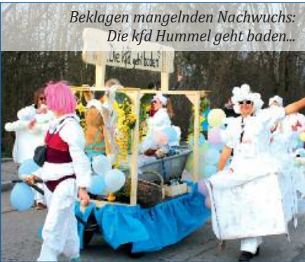
Beklagen mangelnden Nachwuchs: Die Kfd Hummel geht baden...