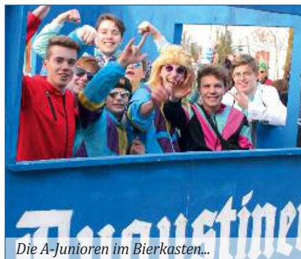
Die A-Junioren im Bierkasten...