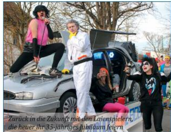
Zurück in die Zukunft mit den Laienspielern, die heuer ihr 35-jähriges Jubiläum feiern

E in großes Ereignis für Faschingsbegeisterte jeden Alters war auch heuer der Faschingszug, der sich diesmal schon am Samstag vor dem Faschingssonntag durch den Ortskern bewegte.