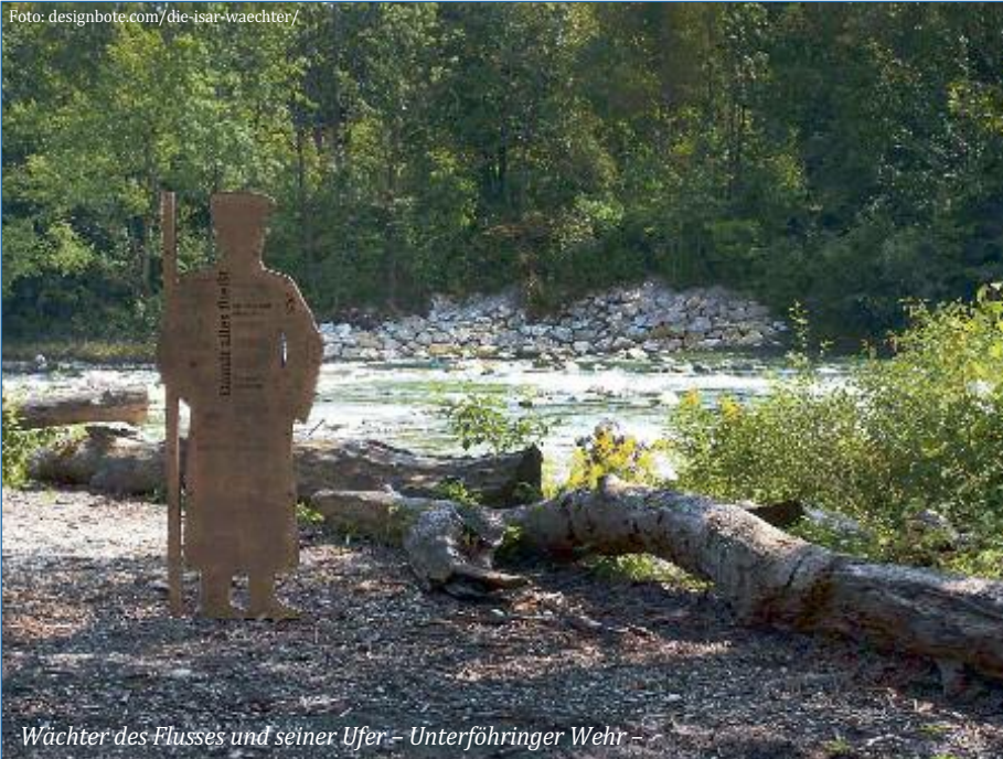
Wächter des Flusses und seiner Ufer - Unterföhringer Wehr -

Das Wasserwirtschaftsamt München setzte im Rahmen des Gewässerentwicklungskonzepts (GEK) Mittlere Isar und des Hochwasserschutzprogrammes Isar 2020 zahlreiche Maßnahmen zur Verbesserung des Hochwasserschutzes und der ökologischen Situation an der Mittleren Isar um.