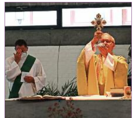
Der feierliche Wettersegen erflachte Schutz gegenüber jedem Unwetter.