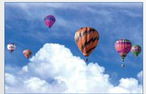
Ferienprogramm 2021 S. 19