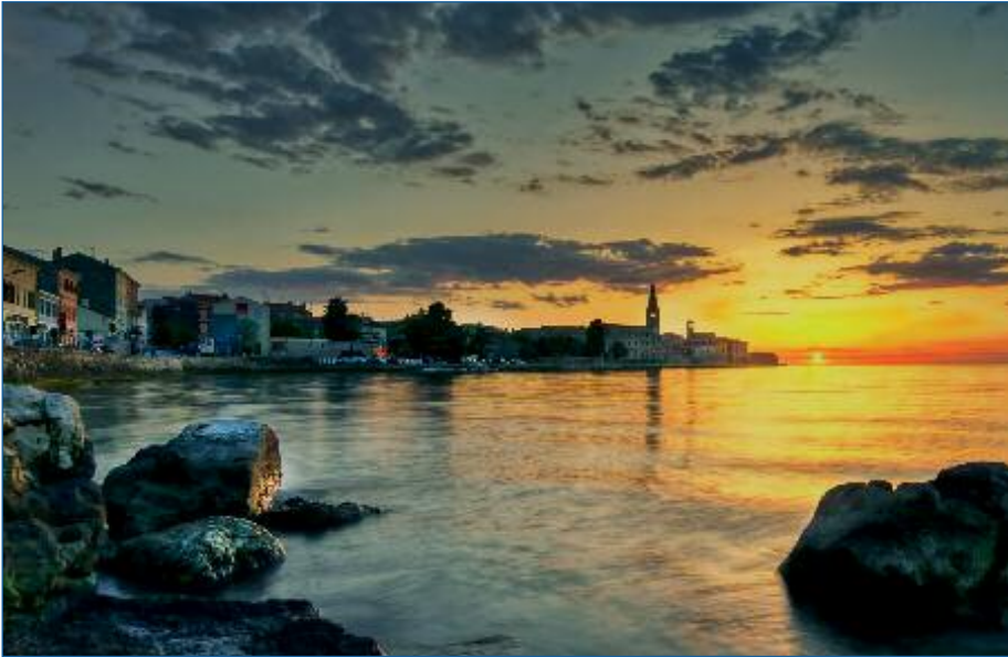
Sehr romantisch und immer eine Reise wert: Die Küste Kroatiens mit ihren malerischen Orten...

D as traditionelle Sommerfest darf in der bekannten Form in diesem Jahr nicht durchgeführt werden. Alternativ findet am Samstag, 24. Juli 2021 ab 12:00 Uhr ein »Sommertreffen« im Biergarten des Alten Wirt statt. Einfach wieder beieinander sein, heißt die Devise. Für unsere Seniorinnen und Senioren ab Jahrgang 1951 und älter wird dazu ein 10 Euro Verzehrsgutschein ausgegeben, wie es sonst