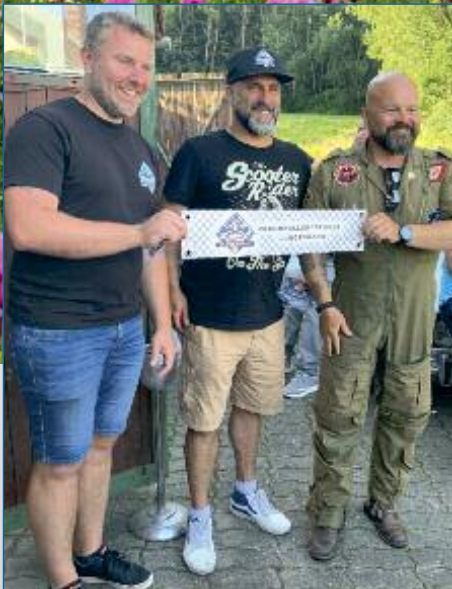
Spendenaktion Blechrollerfreunde S. 34