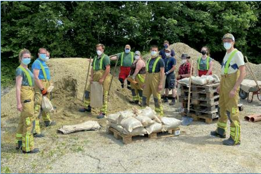
Die Gemeinde Langenbach bedankt sich herzlich bei allen freiwilligen Helferinnen und Helfern der beiden Feuerwehren, die bei den letzten Starkregenereignissen beim Sandsackfüllen geholfen haben.

Nachdem der nächste Regen angekündigt war, wollten wir den Bürgerinnen und Bürgern zusätzliche Maßnahmen zum Eigenschutz geben. Schnell war die Freiwillige Feuerwehr engagiert zum Sandsäcke füllen. An dieser Stelle: Vielen herzlichen Dank an alle fleißigen Helferinnen und Helfer der Feuerwehren Langenbach und