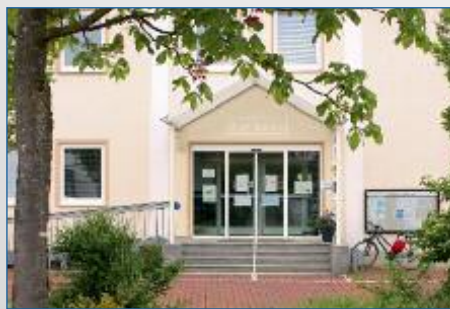
Rathaus wieder geöffnet S. 5