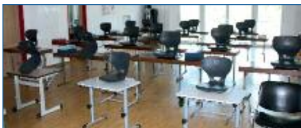
Hier wurde über 10 Wochen lang unterrichtet: Der Schulungsraum der FFW Ober- und Niederhummel.

Vom 12. April bis zum 23. Juni waren die Klassen 4a und 4b der Grundschule im Feuerwehrhaus in Niederhummel untergebracht.