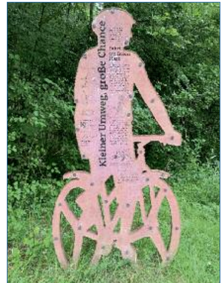
Wächter der Radfahrer bei Oberhummel

i Wer die einzelnen Wächter sind und warum sie entlang der Isar zwischen München und Moosburg stehen erfahren Sie hier: www.wwa-m.bayern.de/fluesse_seen/massnahmen/gek_mittlere_isar/waechter/index.htm