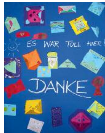
Auch die Klasse 4b, die im Gemeindesaal untergebracht war, dankte mit einem netten Abschiedsbrief für die spontane Aufnahme.

Mit dem Rückgang der Corona-Fallzahlen wurde der Unterricht wieder nach Langenbach verlegt, auch wenn Lehrkräfte und Schüler nur wehmütig von ihrem Ausweichquartier Abschied nahmen. ■