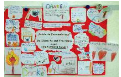
So bedankten sich die Kinder bei den »Hausherrn« von der FFW Hummel.