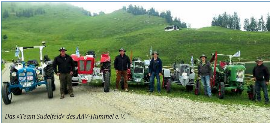
Das »Team Sudelfeld« des AAV-Hummel e. V.

Aufgrund der anhaltenden Umstände ist die Traktor-WM am Großglockner heuer zum zweiten Mal abgesagt worden. Oldtimertreffen finden dieses Jahr auch wieder nicht statt. Aber die Traktoren und ihre Fahrer brauchen Bewegung.